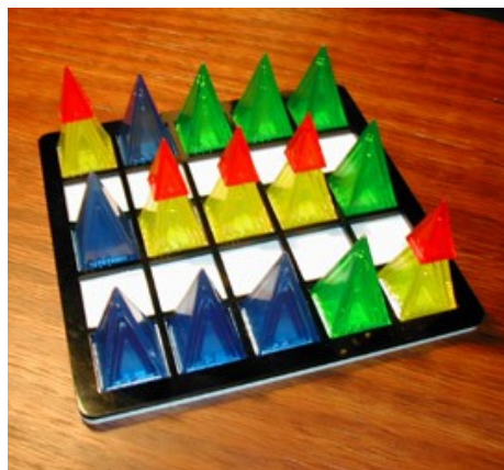
Disposition 5x5, avec plateau