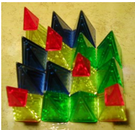
Disposition 4x4, sans plateau

Vous devez ensuite décider quelle disposition vous allez utiliser. Comme dans Volcano, plusieurs arrangements de couleurs sont possibles au sein de la surface de jeu, mais vous pouvez aussi choisir de jouer sur une grille de 4x4 presque pleine ou sur un plateau de 5x5 plein de cases vides, comme le montrent les illustrations. Les deux dispositions permettent des parties agréables... essayez-les pour savoir laquelle vous préférez.